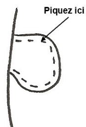
Poches endroit contre endroit